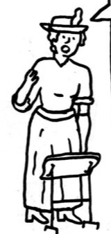
Rosa Luxemburg 1898

Dans l'économie capitaliste l'échange domine la production; il exige, pour que puisse vivre l'entreprise, une exploitation impitoyable de la force de travail. Cela se traduit par la nécessité d'intensifier le travail, d'en raccourcir ou d'en prolonger la durée selon la conjoncture, d'embaucher ou de licencier la force de travail selon les besoins du marché, en un mot de pratiquer toutes méthodes bien connues qui permettent à une entreprise capitaliste de soutenir la concurrence des autres entreprises. D'où, pour la coopérative de production, la nécessité, contradictoire pour les ouvriers, de se gouverner eux-mêmes avec toute l'autorité absolue nécessaire et de jouer vis-à-vis d'eux-mêmes le rôle d'entrepreneurs capitalistes.